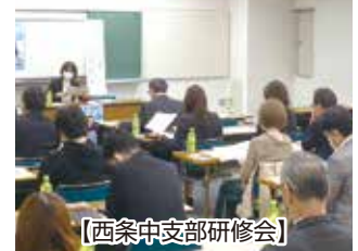
【西条中支部研修会】