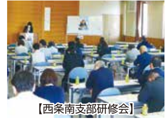
【西条南支部研修会】