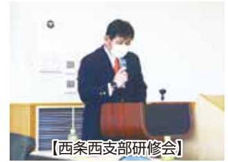
【西条西支部研修会】