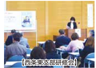
【西条東支部研修会】