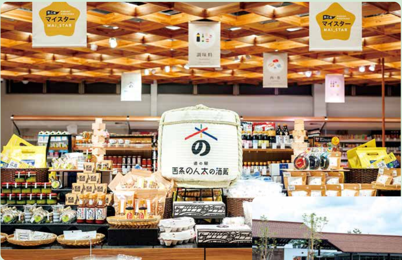
道の駅西条のん太の酒蔵