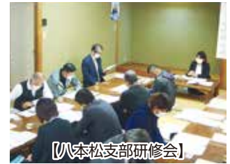
【八本松支部研修会】