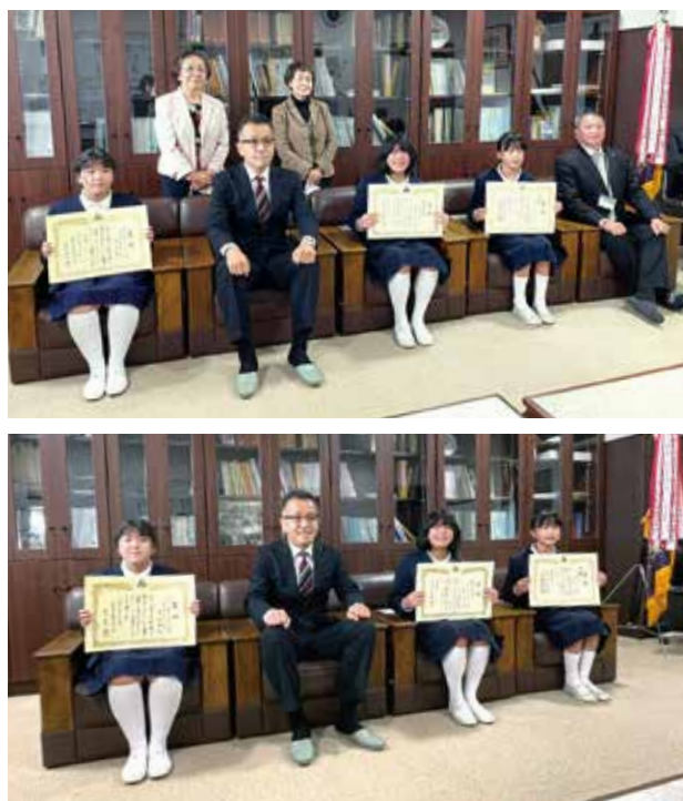
受賞者との記念撮影