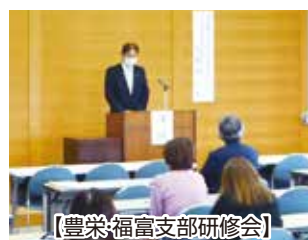
【豊栄・福富支部研修会】