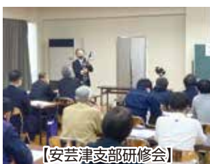
【安芸津支部研修会】