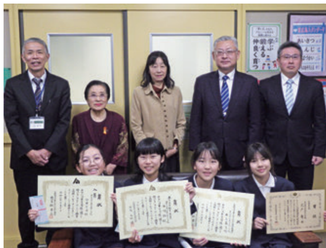
西条税務署長賞受賞者との記念撮影