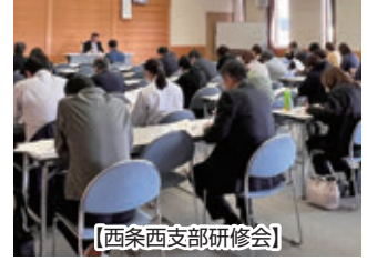
【西条西支部研修会】