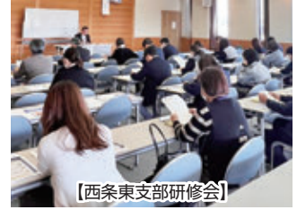
【西条東支部研修会】