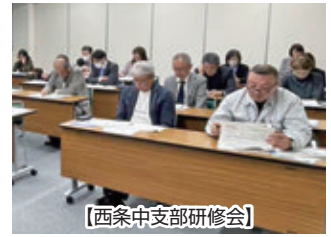
【西条中支部研修会】