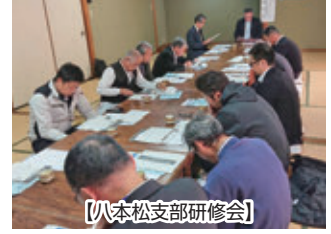
【八本松支部研修会】