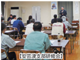
【安芸津支部研修会】