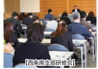
【西条南支部研修会】