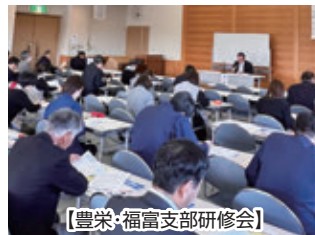
【豊栄・福富支部研修会】